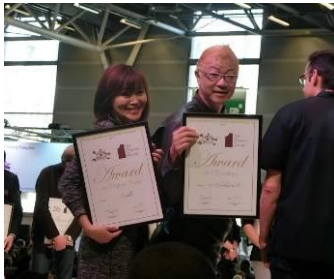
辻口博啓シェフと パリのサロン・デュ・ショコラの表彰式にて