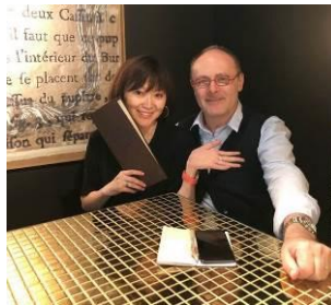
ジャン=ポール・エヴァンシェフとパリにて