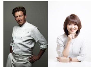
2022年1月にピエール・マルコリーニ氏と ベルギー大使館にて対談