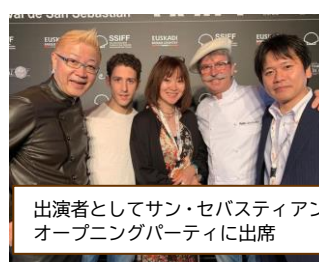
出演者としてサン・セバスティアン国際映画祭のオープニングパーティに出席